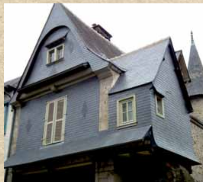
Centre historique de Vitré