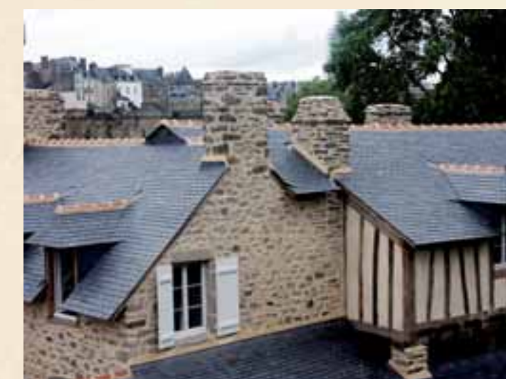
Ancien lavoir de la GARENNE à Vannes