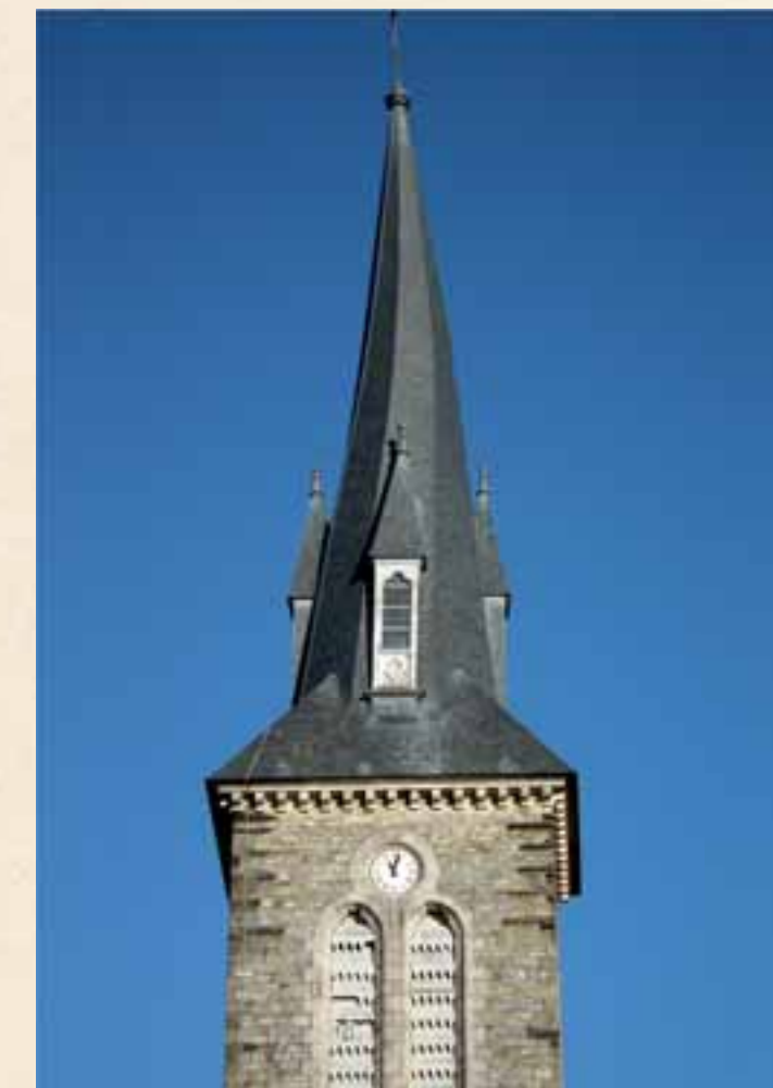
Clocher ST Jean/Vilaine