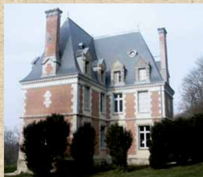
Château dans la Sarthe